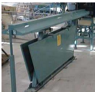
Foto 1.6 Descarregador