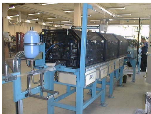
Foto 1.3 Estrutura com ferramentas, três de espiga, uma de ranhura e uma de canto, fresagem e dispositivo de guia de banda de aço.