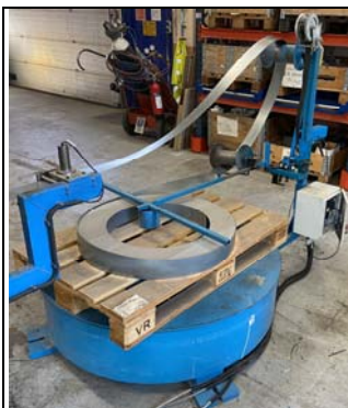
Foto 1.2 Desbobinador