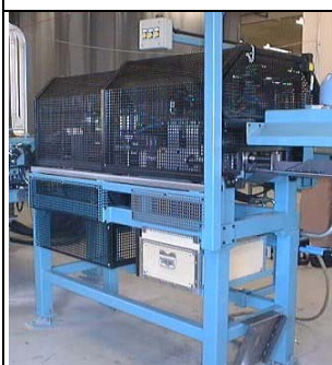
Foto 1.5 Estrutura com ferramentas para fresamento de ranhuras e cantos e corte de perfis.