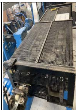
Foto 1.4 Unidade de conformação de rolos